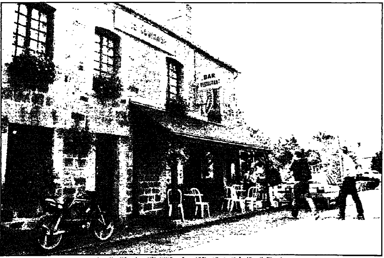
مطعم «لا كوراند» الذي أوقفت فيه الشرطة الفرنسية يوم الثلاثاء الماضي مائتين كلان